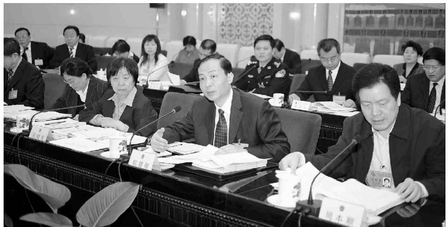
4月23日,十一届全国人大常委会第二次会议分组审议残疾人保障法修订草案